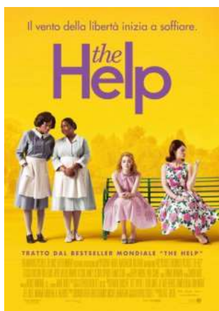
The Help , 2011, di Tate Taylor con Emma Stone, Viola Davis, Octavia Spencer, Bryce Dallas Howard und Jessica Chastain