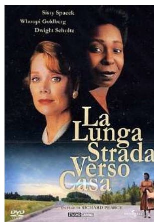
The long walk home (La lunga strada verso casa), 1990, di Richard Pearce con Sissy Spacek e Whoopi Goldberg