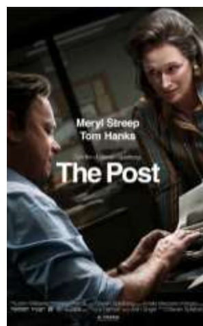
The Post , 2017, di Steven Spielberg con Meryl Streep