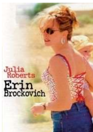
Erin Brockovich , 2000, di Steven Sodebergh con Julia Roberts