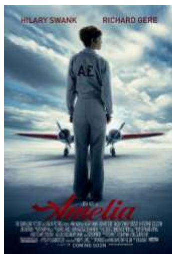
Amelia , 2009, di Mira Nair con Hilary Swank