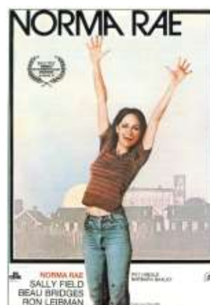
Norma Rae , 1979, di Martin Ritt con Sally Field