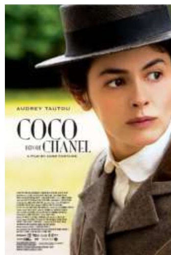
Coco before Chanel (L'amore prima del mito), 2009, di Anne Fontaine con Audrey Tautou