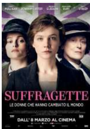
Suffragette , 2015, di Sarah Gavron, con Helena Bonham Carter e Meryl Streep