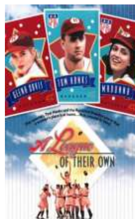
A League of their own (Ragazze vincenti), 1992, di Penny Marshall con Geena Davis e Madonna