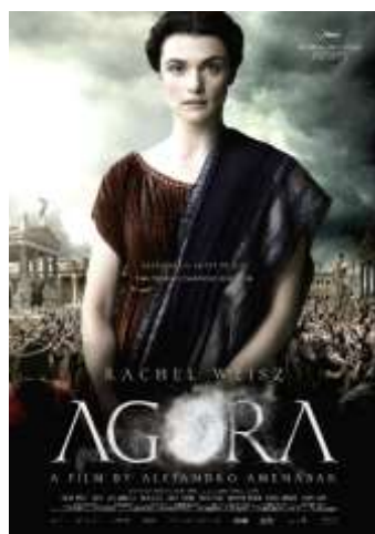
Agora , 2009, di Alejandro Amenabar con Rachel Weisz