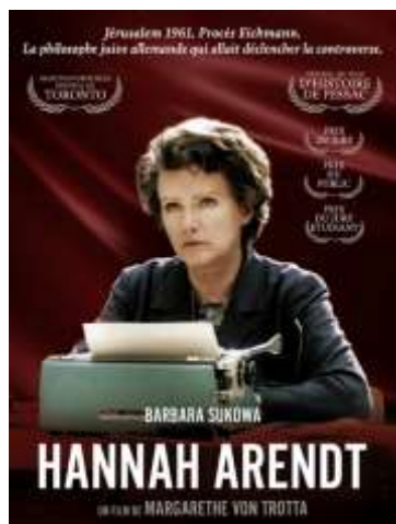
Hannah Arendt , 2012, Margarethe Von Trotta con Barbara Sukowa