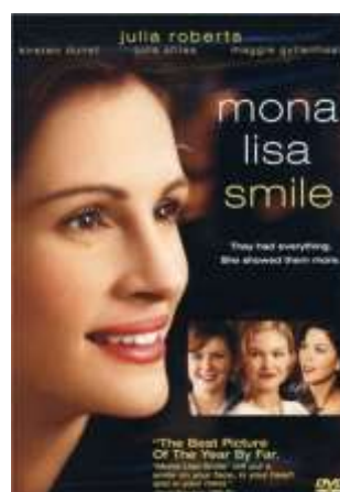
Mona Lisa Smile , 2003, di Mike Newell con Julia Roberts, Kirsten Dunst e Maggie Gyllenhaal