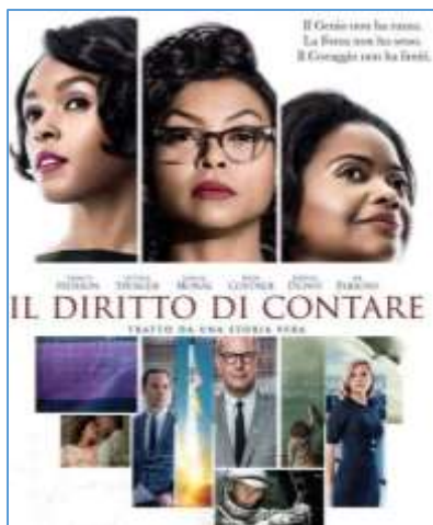
Hidden figures (Il diritto di contare), 2016, di Theodore Melfi con Taraji Henson, Octavia Spencer e Janelle Monáe